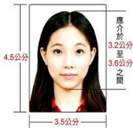
符合規格照片（實際尺寸）